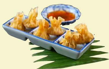
Wan Tan / Thai Money Bags