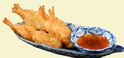
Knusprige Crevetten / Crispy Prawns