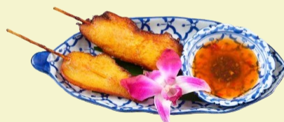
Poulet Spiessli / Chicken Satay

2 Stück mit Gemüse / with Vegetables hausgemacht