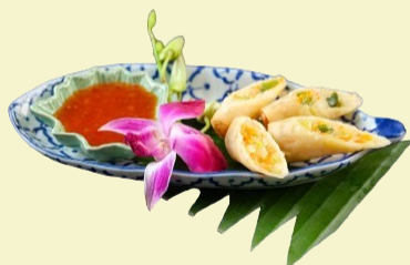
Frühlingsrollen / Spring Rolls