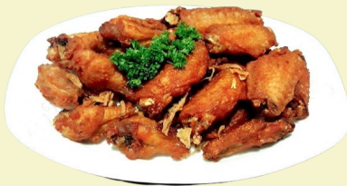
Poulet Flügel / Chicken Wings