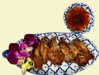
Poulet Flügel / Chicken Wings